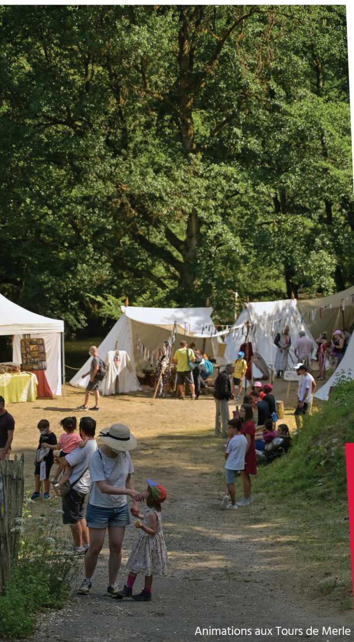
Animations aux Tours de Merle