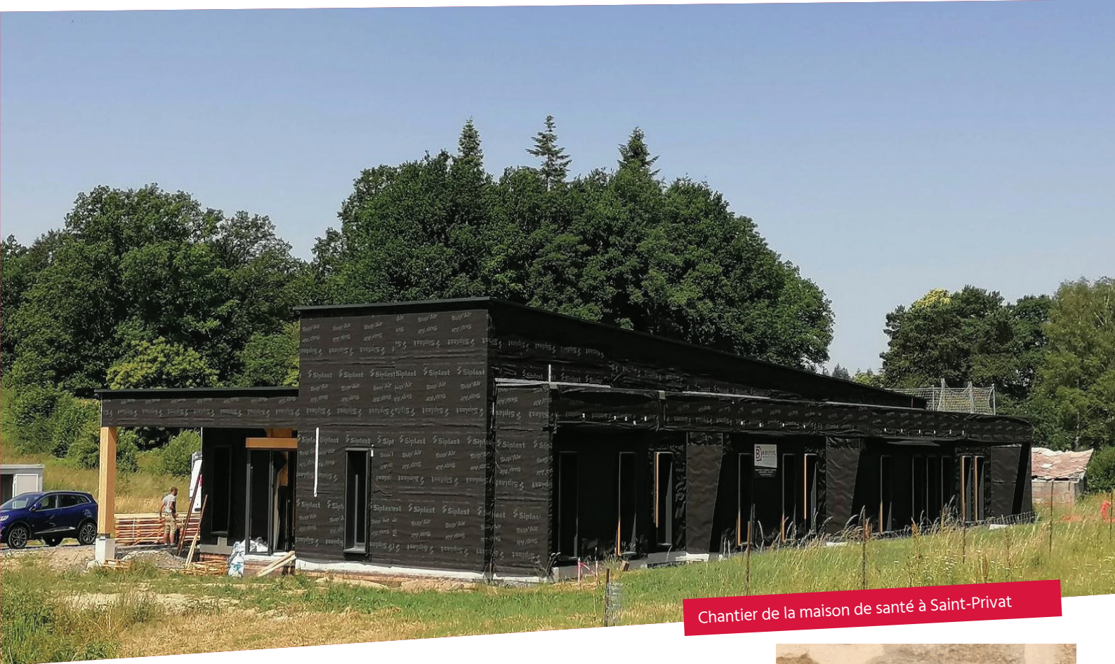
Chantier de la maison de santé à Saint-Privat

La problématique de la Santé est au cœur des préoccupations. Afin de rendre le territoire attractif pour les personnels de santé, la Communauté de Communes porte deux maisons de santé : une à Argentat ouverte en 2018 et une à Saint-Privat dont l'ouverture est programmée début 2023.