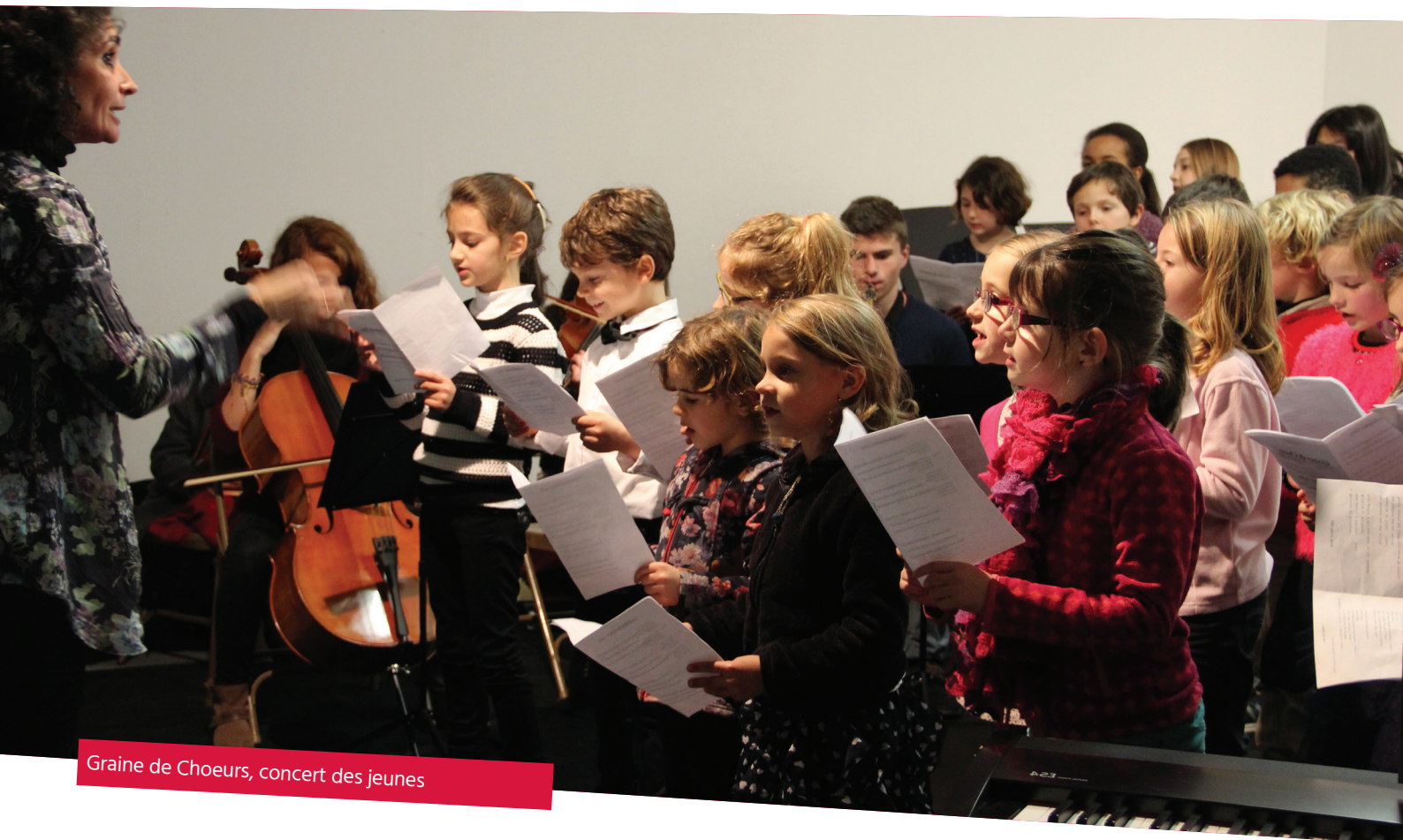
Graine de Choeurs, concert des jeunes