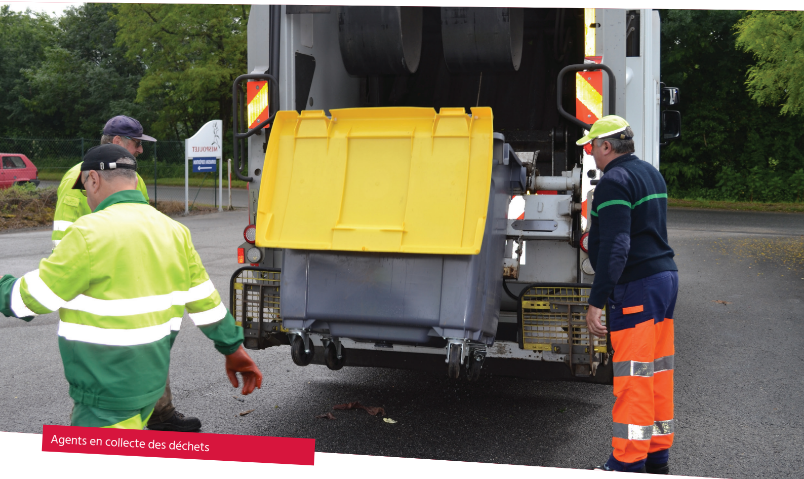
Agents en collecte des déchets

Le conseil communautaire du 19 mai a adopté sa nouvelle politique locale en matière de déchets. Des choix assumés pour anticiper les augmentations financières à venir et impliquer les habitants dans de bonnes pratiques. Explications.