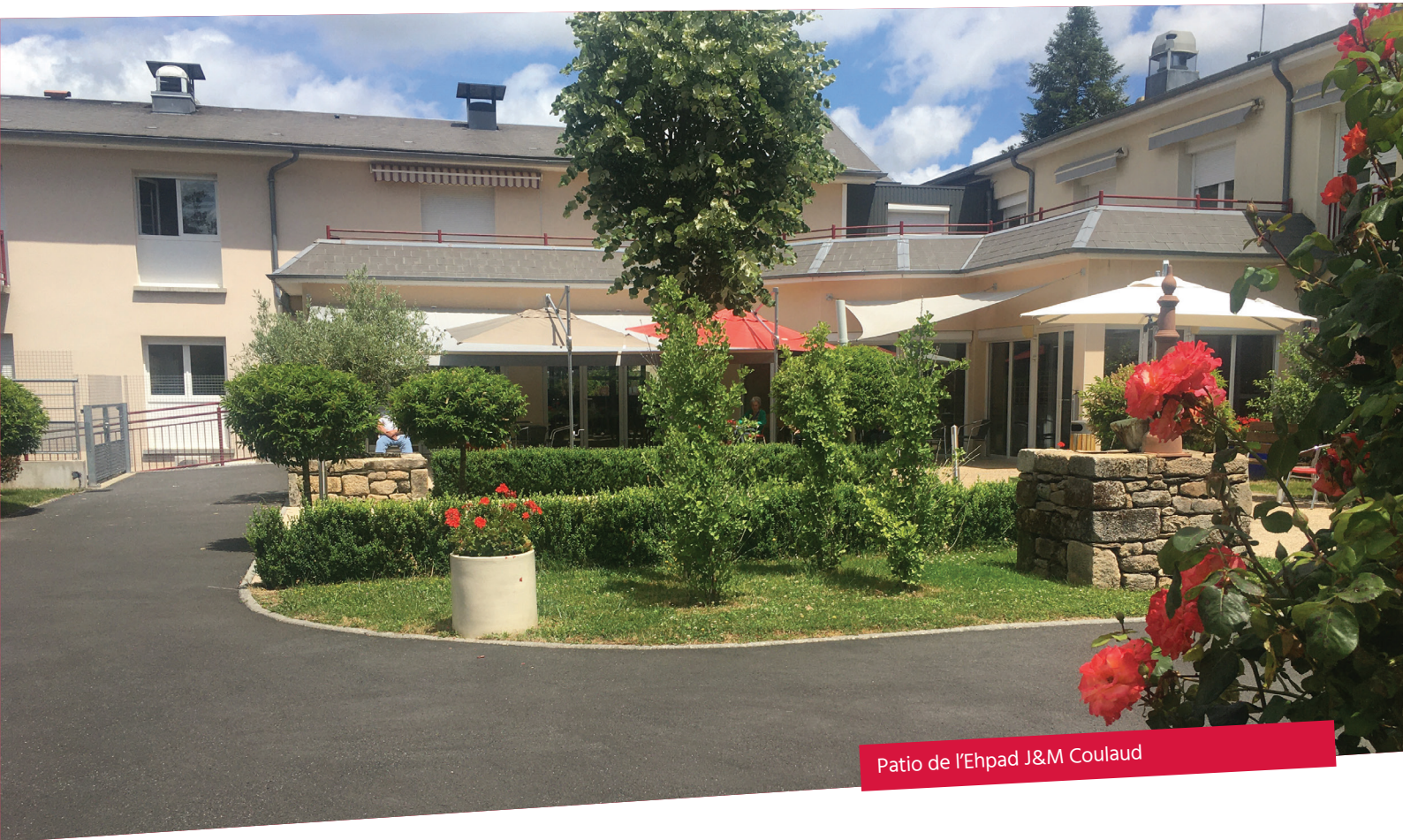
Patio de l'Ehpad J&M Coulaud

Ouvert en 1973, l'Ehpad intercommunal accueille 70 résidents. Ce sont en tout 52 collaborateurs qui contribuent quotidiennement au bien-être des résidents autour de projets innovants. Explications.