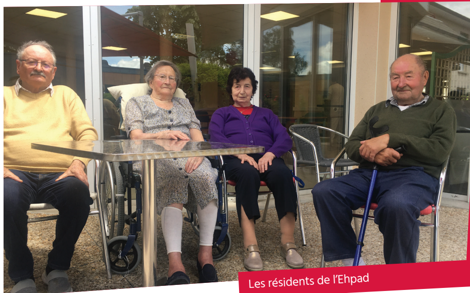
Les résidents de l'Ehpad