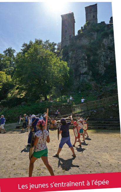
Les jeunes s'entraînent à l'épée

La pièce de théâtre « Merle se joue des Tours » sera aussi revisitée. Pour apprécier le décor du site, ce spectacle déambulatoire invitera les cinquante spectateurs à vivre avec les seigneurs des Tours du 15 ème siècle. Ce moment intime sera proposé 7 soirées dans l'été (dimanche ou lundi), dont celle du 3 juillet spécialement adaptée pour un public à mobilité réduite.