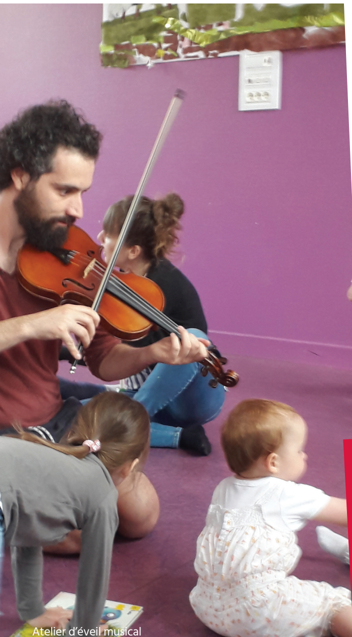
Atelier d'éveil musical