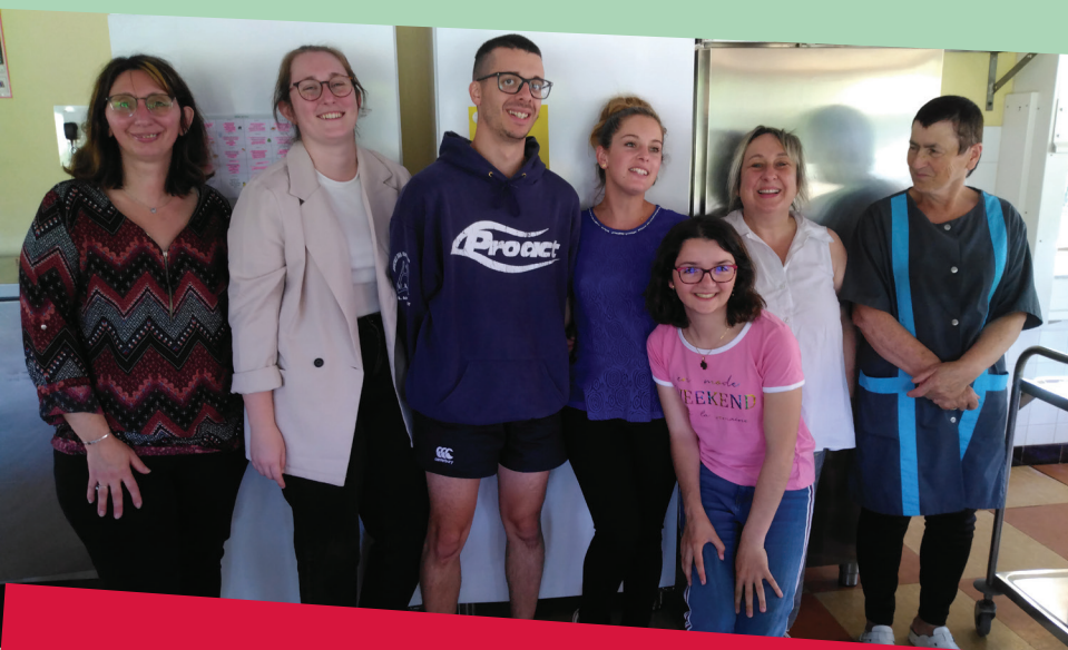
L'équipe de l'accueil de Loisirs